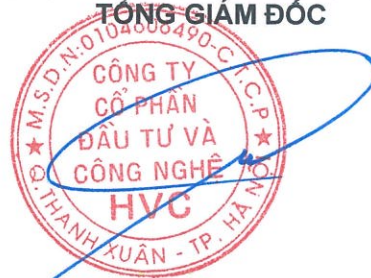
Trần Hữu Đông